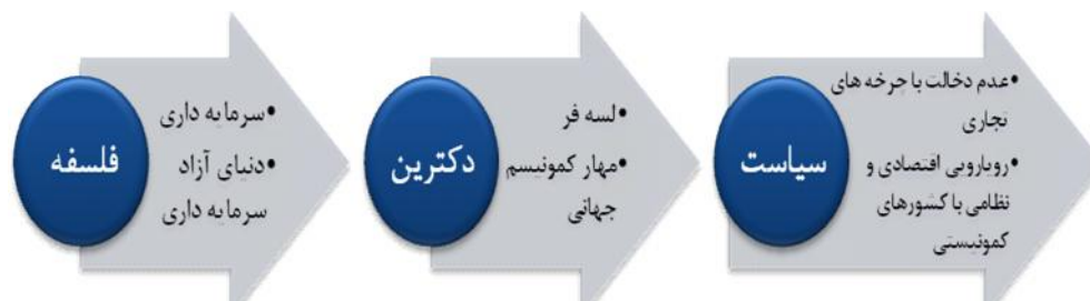
نمودار ۲: رابطه فلسفه، دکترین و سیاست

شناخت دکترین، از آنجایی شروع می‌شود که هر فلسفه و نظام شناختی، الزاما برای پیاده شدن در متن اجتماع و بیان چگونگی حیات انسانی، نیاز به واسطه‌ای دارد. ۱ بر این اساس، دکترین موضوعیت پیدا می‌کند که غبار ابهام را از چهره آن می‌زداید تا بتواند به سیاست‌های مشخصی جهت اداره انسان تبدیل شود. از این حیث، دکترین حاکم، ضرورتاً یک ایدئولوژی و مجموعه‌ای سازمان یافته درباره بهترین شیوه زندگی مردم و درباره مناسب‌ترین ترتیبات نهادی برای جوامع‌شان می‌باشد. بنابراین، دکترین (یا قاعده القواعد) تبیین و تشریح قواعد ذاتی حاکم بر خلقت، طبیعت و قواعد ذاتی حاکم بر اعمال موجودات، به ویژه بشر است. تبیین این قواعد برای جامعه‌سازی الزامی است. لذا موضوع این رویکرد، مطالعه جامعه از حیث «باید»، مبتنی بر قواعد ذاتی حاکم بر خلقت، طبیعت و رفتار موجودات و انسان است. نمودارهای زیر، روابط مزبور را به همراه مصداقی روشن، به خوبی ترسیم کرده است (شافریتز و پی. بریک، ترجمه ملک محمدی، ۱۳۹۰: ۲۸۳-۲۹۹)