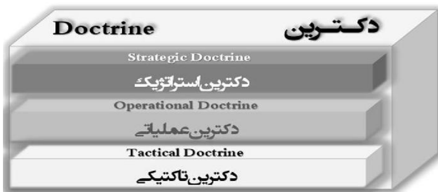
نمودار ۳: لایه‌های دکترین

از اقدامات روبرو هستیم که به طور عمده براساس گستره زمانی، اهمیت و دامنه اثرگذاری در سه سطح استراتژیکی، عملیاتی و تاکتیکی تقسیم‌بندی می‌شوند. هر سطح، به حضور مؤثر و پیاده‌سازی دکترین پایه در سطح اجتماع، کمک می‌کند. ۱ از آنجایی که رویکرد مورد نظر نقش مدل‌سازی دارد، هر یک از این سطوح زیرمجموعه دکترین و با عنوان لایه‌های دکترینال شناخته می‌شوند و به مثابه مجاری عینیت یافتن دکترین به شمار می‌آیند که عبارتند از: دکترین استراتژیکی، دکترین عملیاتی و دکترین تاکتیکی ۲ . بنابراین، ساختار کلی آن به شکل زیر است: