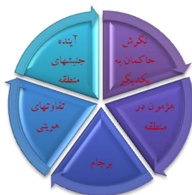
شکل ۴- پیش‌رانه‌های نهایی میک‌مک

۵- آینده جنگ در عراق، سوریه و... و تأثیر آنها بر روابط ایران و شورای همکاری.